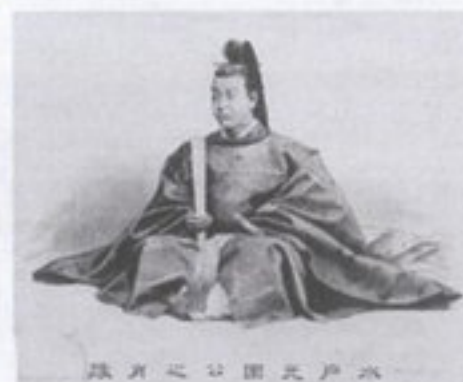
徳川光圀公肖像画 (京都大学付属図書館蔵)