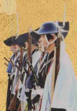
おもてなし武将隊 羽州上山武将隊 平成上山藩 小銃大砲隊